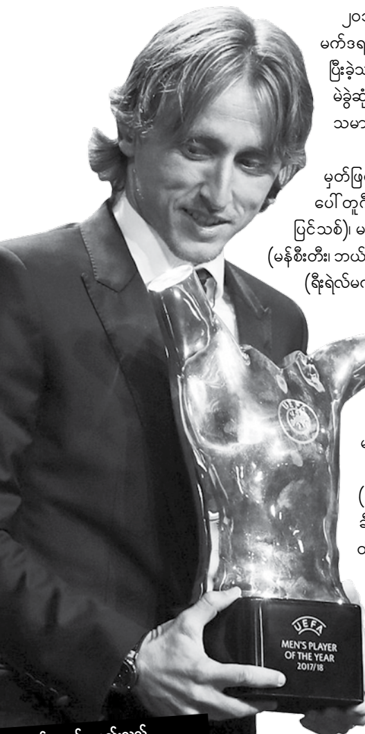
ဟန်နေသစ် စုစည်းသည်

၂၀၁၇-၂၀၁၈ ဘောလုံးရာသီ တစ်နှစ်တာအကောင်းဆုံး ဘောလုံးသမားဆုကို ရီးရဲလ်မက်ဒရစ်အသင်းမှ ခရိုအေးရှား ကွင်းလယ်ကစားသမား လူကာမိုဒရစ်က ရရှိသွားခဲ့သည်။ ပြီးခဲ့သည့် ဩဂုတ် ၃၁ ရက်က ပြင်သစ်နိုင်ငံ မိုနာကိုမြို့တွင် ချန်ပီယံလိဂ်အုပ်စုပွဲစဉ်များကို မဲခွဲဆုံးဖြတ်ခဲ့မှုနှင့်အတူ တစ်နှစ်တာ အကောင်းဆုံးကစားသမားနှင့် နေရာအလိုက်ကစားသမားများကိုလည်း မဲပေးရွေးချယ်ခဲ့ခြင်းဖြစ်သည်။