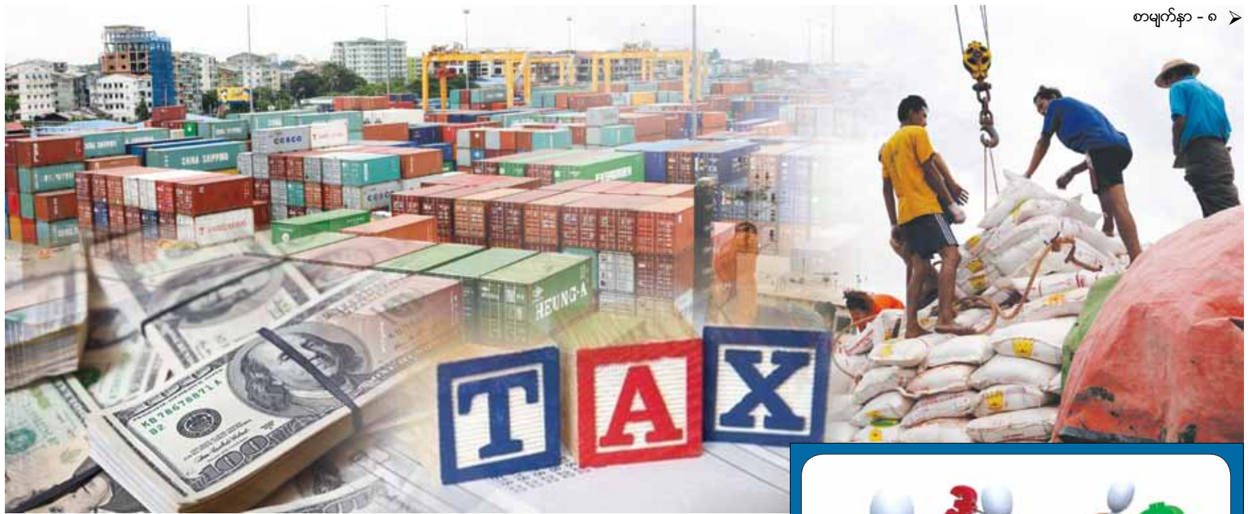
စာမျက်နှာ - ၈ >

နိုင်ငံတကာ သတ်မှတ်ချက်နှင့်အညီ စနစ်တကျလိုက်ပါ ပြင်ဆင် ဆောင်ရွက်ရမည့် မြန်မာ့ E-Commerce