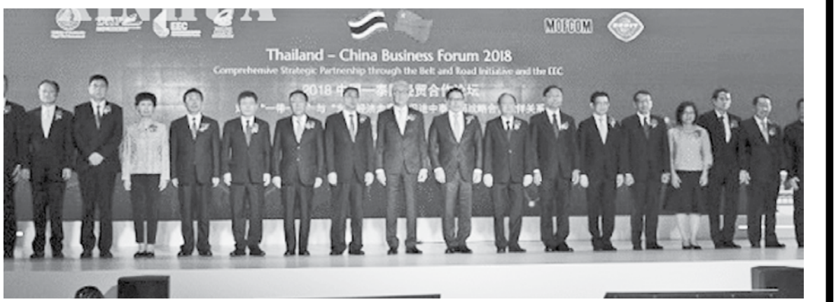
၂၀၁၈ ခုနှစ် တရုတ်-ထိုင်း စီးပွားရေးနှင့် ကုန်သွယ်ရေး ဖိုရမ်တွင် စုပေါင်းအမှတ်တရ ဓာတ်ပုံရိုက်ကူးစဉ်။

တရုတ်နိုင်ငံ၏ ခေတ်သစ်ပိုးလမ်းမကြီး အဆိုပြုချက်သည် အထူးကောင်းမွန်ကြောင်းနှင့် ထိုင်းနိုင်ငံအနေဖြင့် အပြည့်အဝ ထောက်ခံကြောင်း ထိုင်းနိုင်ငံ ဒုတိယဝန်ကြီးချုပ် Somkid Jatusripitak က ပြီးခဲ့သောရက်များတွင် ဘန်ကောက်မြို့၌ ကျင်းပခဲ့ သည့် စီးပွားရေးနှင့် ကုန်သွယ်ရေး ပူးပေါင်းဆောင်ရွက်မှုဖိုရမ်တွင် ပြောကြားခဲ့ကြောင်း သိရသည်။ ခေတ်သစ်ပိုးလမ်းမကြီး စီမံကိန်းသည် နိုင်ငံများအကြား ပူးပေါင်းဆောင်ရွက်မှုကို တွန်းအားပေးနိုင်သလို သက်ဆိုင်ရာ နိုင်ငံများ၏ လူမှုစီးပွားဖွံ့ဖြိုးတိုးတက်မှု ထပ်လောင်းအင်အား လည်းဖြစ်ကြောင်း၊ ခေတ်သစ်ပိုးလမ်းမကြီး အဆိုပြုချက်သည် ဘက်ပေါင်းစုံ အကျိုးဖြစ်ထွန်းစေရန် ရည်ရွယ်ဆောင်ရွက်ခြင်း ဖြစ်ပြီး အပြန်အလှန် ဆက်သွယ်သွားလာနိုင်သည့်အတွက် ထိုင်း နိုင်ငံအနေဖြင့် အပြည့်အဝထောက်ခံကြောင်း Somkid Jatusripitak က ၂၀၁၈ ခုနှစ် တရုတ်-ထိုင်း စီးပွားရေးနှင့် ကုန်သွယ်ရေးပူးပေါင်း ဆောင်ရွက်မှုဖိုရမ်တွင် ပြောကြားခဲ့သည်။ ဆက်လက်၍ ၎င်းက ခေတ်သစ်ပိုးလမ်းမကြီး မူဘောင် အောက်တွင် စီမံကိန်းများသည်လည်း တိုးတက်မှုအခြေအနေ ကောင်းမွန်သောကြောင့် မိမိအနေဖြင့် အထူးဝမ်းသာမိကြောင်း၊ တရုတ်-လာအို၊ ထိုင်း ရထားလမ်း စီမံကိန်းကိုလည်း မြှင့်တင် ဆောင်ရွက်လျက်ရှိရာ ထိုင်း-တရုတ် ရထားလမ်းပူးပေါင်းဆောင် ရွက်မှုစီမံကိန်း၏ ပထမလုပ်ငန်းစဉ် အဓိကအပိုင်းဖြစ်သည့် တင်ဒါခေါ်ယူမှုများ စတင်ဆောင်ရွက်ပြီဖြစ်ရာ အောင်မြင်စွာ