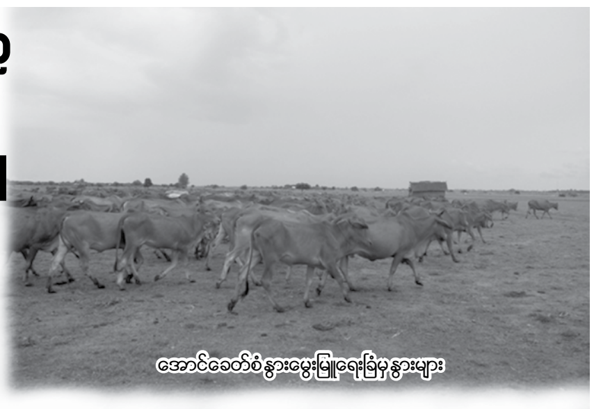
အောင်ခေတ်စံ နွားမွေးမြူရေးခြံမှ နွားများ